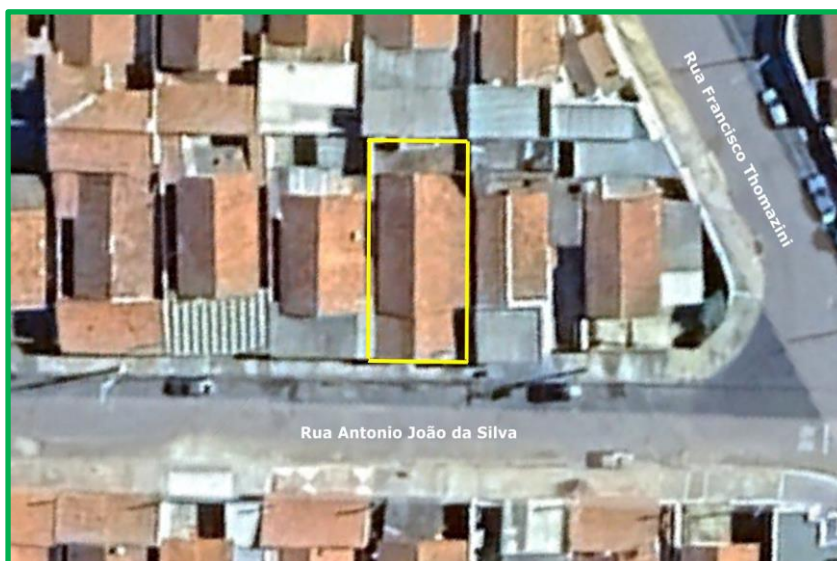
Figura 02: Vista aérea do imóvel inspecionado.