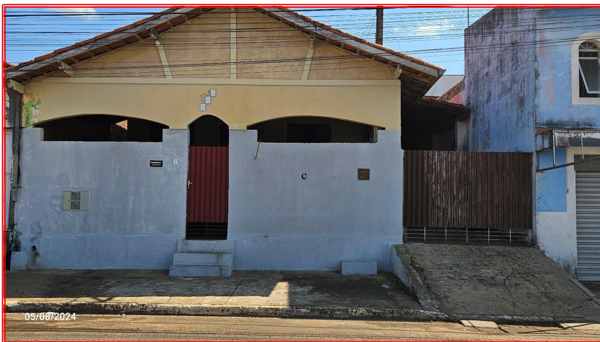
Foto 01: Fachada do imóvel situado no nº 408 da Rua Antônio João da Silva.

A seguir são apresentadas reproduções fotográficas realizadas durante a vistoria realizada em 05 de agosto de 2024 .